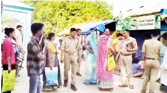
घाट पर मौजूद मृतक के परिजन व पुलिस।