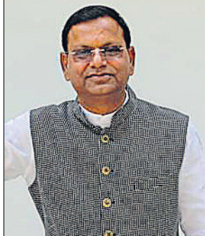
acquisition of land has started and farmers are getting compensation. The constituency has a good network of roads, the villages in the far-flung areas have power connectivity. The construction of a medical college is complete and a passport office has opened in the district. A new sugar mill will be set up in Pharenda after the closure of the old one.

M aharajganj Union minister of state for finance and six-term MP Pankaj Chaudhary is in fray from his traditional stronghold of Maharajganj on the BJP ticket. A prominent OBC face of the BJP in the Purvanchal region (eastern Uttar Pradesh), Chaudhary is seeking a seventh term in the Lok Sabha. He is facing a challenge from Congress candidate Virendra Chaudhary, the party's sitting MLA from Pharenda, and Bahujan Samaj Party candidate Mohammad Mausme Alam. During the centenary celebration of the Gita Press, Gorakhpur, in July last year, Prime Minister Narendra Modi visited Pankaj Chaudhary's residence to give a message to the OBC voters who have become an important support base for the BJP in Uttar Pradesh. In a conversation with Rajesh Kumar Singh , he spoke about various issues, including his relations with CM Yogi Adityanath, the OBC factor, the "Save Constitution" campaign of the opposition and the anti-incumbency factor. Excerpts: