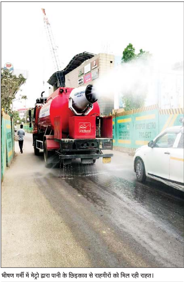
भौषण गर्मी में मेट्रो द्वारा पानी के डिब्बों से राहगीरों को मिल रही राहत।