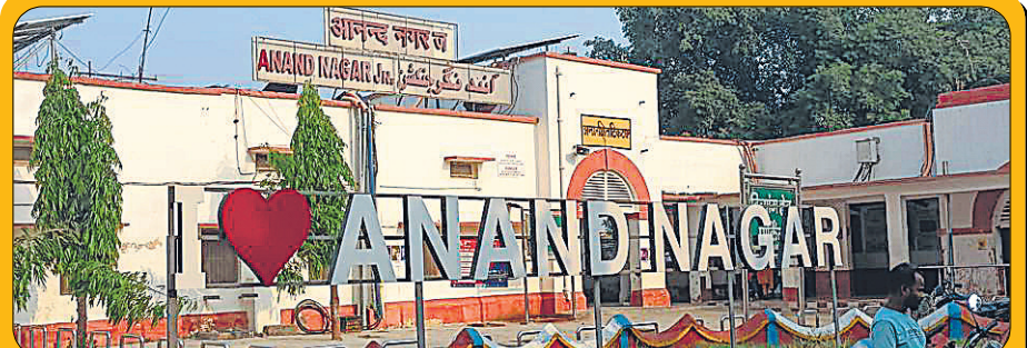
Anandnagar junction connects the district with major cities, but the headquarters does not have a railway station.