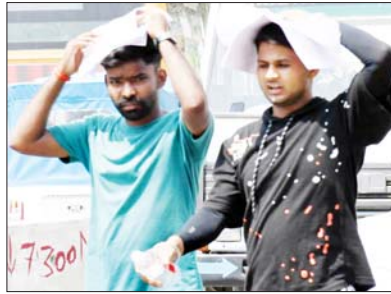
नौबस्ता की जलन से बचते लोग।

नगर के दिन पर दिन बदल रहे मौसम से गुरुवार को उमस का साम्राज्य कायम रहा। सुबह आये बादल दोपहर में गह्राये जिससे नगर का तापमान अधिक नहीं बढ़ सका। बादलों के कारण तापमान में थोड़ी गिरावट दर्ज हुई। कृषि विश्वविद्यालय ने गुरुवार को अधिकतम तापमान 44.2 व न्यूनतम 30.6 डिग्री मापा जबकि एयरफोर्स स्टेशन में अधिकतम पारा 46.8 डिग्री व न्यूनतम 33.8 डिग्री सेल्सियस रिकॉर्ड किया गया। यह पारा भी जन्मानस को झुलसाने के लिये पर्याप्त रहा। दोपहर चली हीट वेव यानी लू की चपेट में गुरुवार को कई राहगीर आये और राह चलते बेहोश हुये, जिन्हें अस्पताल ले जाया गया। उमस के साथ रही गुरुवार को भीषण गर्मी अभी आने वाले दिनों में भी जारी रहेगी। इस दौरान तापमान कम या अधिक हो सकता है, किंतु भीषण गर्मी से राहत की फिलहाल कोई उम्मीद नहीं दिख रही है। भीषण गर्मी से पशु, पक्षी भी बेहाल नजर आ रहे हैं और टंड को