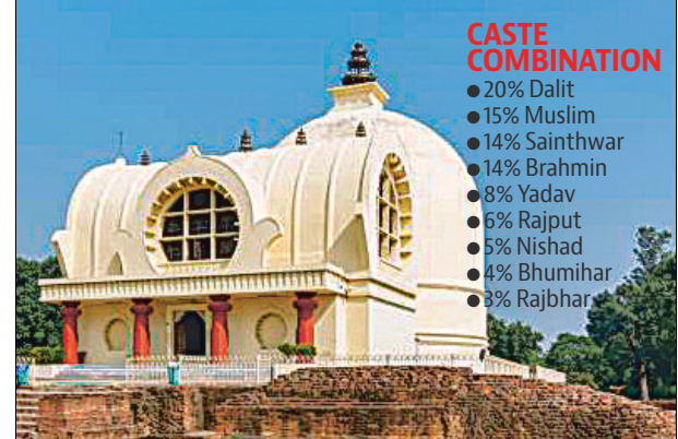
district headquarters in Padrauna. The campaign also emphasises welfare projects, including housing, ration distribution, water supply, electricity connections, and the Ayushman health card, to win the support of OBC and Dalit voters.

ces, fearing that anti-incumbency against Dubey might benefit the SP-Congress alliance candidate. Union Home Minister Amit Shah and BJP national president JP Nadda have addressed rallies in the constituency, while Yogi has held a series of public meetings in Kushinagar to safeguard the party's prestige. Playing the development card, BJP leaders are also highlighting the construction of international airport, the establishment of a medical college and agriculture university, the renovation of old sugar mills and the establishment of new ones, and the launch of road projects connecting rural areas with the